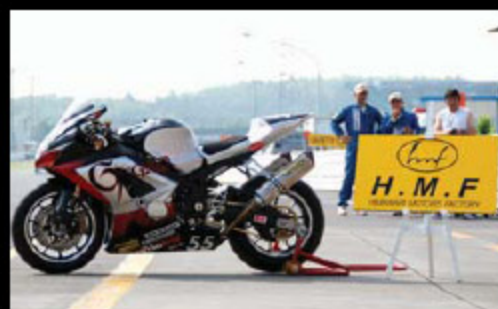
#55 TEAM GAGNER H.M.F GSX-R1000K7