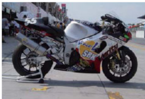
2003年 ゼッケン55 出場クラスXX-F・Div1 予選63位 決勝49位 169Laps クラス14位 記念すべきH.M.F.8耐デビューマシン