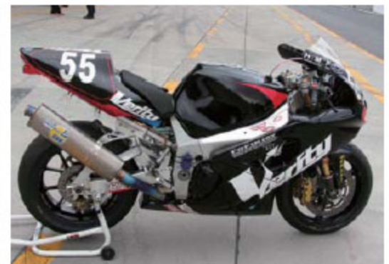
2004年 ゼッケン55 出場クラスSP 予選53位 決勝37位 188Laps クラス3位