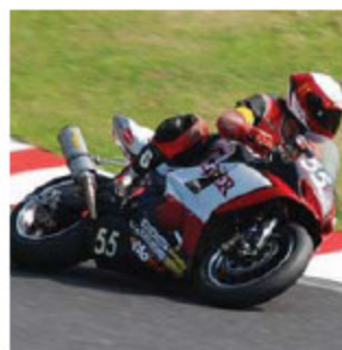
今回4回目の参戦となったチームH.M.F. 全て決勝進出、そして完走と言う記録を継続 する結果となった。