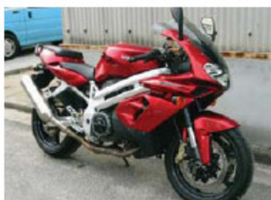
aprilia アプリリアSL1000ファルコ

'01年式 排気量:1000cc 色:赤 走行:6,672km 検出:19/3 保証付 整備済 修復歴無 イタリア製 社外 アプスグレン&オプションマフラー付(カーボン)前後6速ラッチメッシュホース