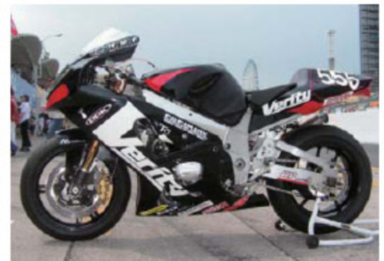
2005年 ゼッケン555 出場クラスSPP 予選47位 決勝48位 174Laps クラス5位